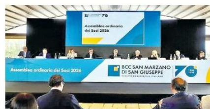
Un momento dell'assemblea di ieri a Masseria Li Reni

nale che vede la progressiva riduzione degli sportelli bancari. «È una controtendenza importante - evidenzia Marco Giorgino, ordinario di Istituzioni e mercati finanziari al Politecnico di Milano - perché il rapporto tra banca e cliente, sia esso impresa o famiglia, deve rimanere molto diretto. Sicuramente la tecnologia aiuta, come molte banche stanno facendo, ma non può sostituire questo rapporto. Vedere che la Bcc di San Marzano va in controtendenza è un segnale positivo. In questo momento di mercato banche e famiglie hanno bisogno di sostegno e sentire una banca vicina, con un rapporto che rimane basato sulla fiducia ma integra il fattore umano e quello tecnologico, è una strada di successo. I numeri di Bcc San Marzano lo dimostrano. Nel sistema bancario italiano c'è bisogno di un consolidamento perché, oltre alla prossimità con i territori, bisogna lavorare sull'efficienza, la redditività e la qualità, e quindi a volte la dimensione aiuta a perseguire questi obiettivi. Avere però un sistema del credito cooperativo come è oggi in Italia, banche rete vicine ai territori ma con servizi centralizzati che permetto-