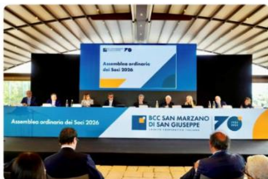
Assemblea dei Soci BCC San Marzano, approvato il bilancio 2025 e rinnovate le cariche sociali all'unanimità