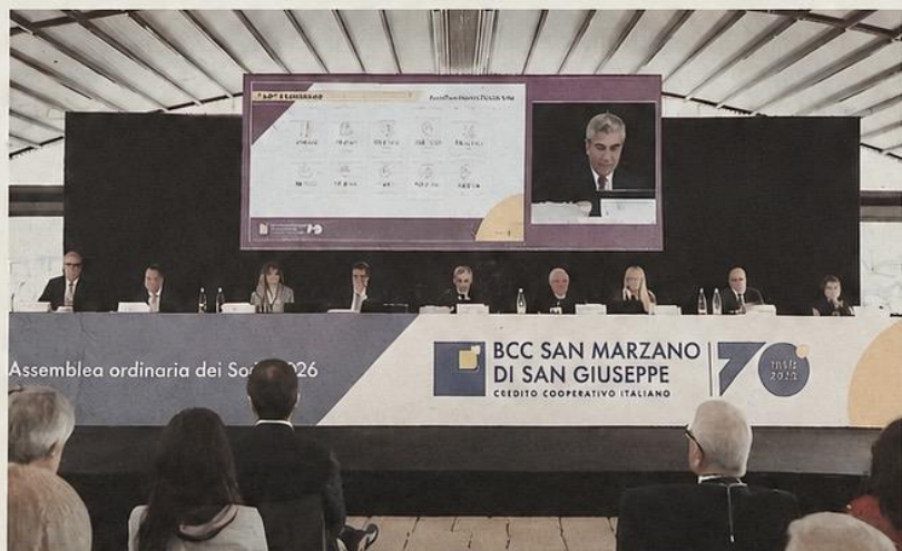
BCC DI SAN MARZANO L'assemblea dei soci

della filiale di Nardò e una nuova sede di rappresentanza a San Marzano di San Giuseppe; una doppia operazione che, sommata a quella di Porto Cesareo del 2025, farà salire a tredici il numero degli sportelli nelle province di Taranto, Brindisi e Lecce. Presentato anche il progetto «Giardino BCC San Marzano», realizzato insieme all'associazione sa-